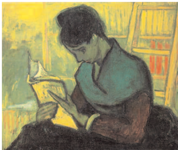
Vincent van Gogh, La lettrice di romanzi (1888).

Quella tra opere d'arte e letteratura è una liaison perfetta: non per niente l'elenco di scrittori e registi che si sono cimentati a questo proposito è lungo e variegato. Il potere evocativo delle tele, la loro portata metaforica e al contempo l'essere oggetti di pregio inestimabile hanno alimentato la fantasia di autori di ogni latitudine, con clamorosi casi di popolarità. Basti pensare al successo del film del regista Peter Webber, ispirato al romanzo omonimo di Tracy Chevalier, La ragazza con l'orecchino di perla , che ruota attorno alla vita del pittore Johannes Vermeer, artista olandese dalle vicende biografiche poco note, chiuso nella sua città (non si mosse da Delft per tutta la vita), che grazie a questo libro è diventato noto anche al pubblico più distratto che ha potuto apprezzare la qualità fol-