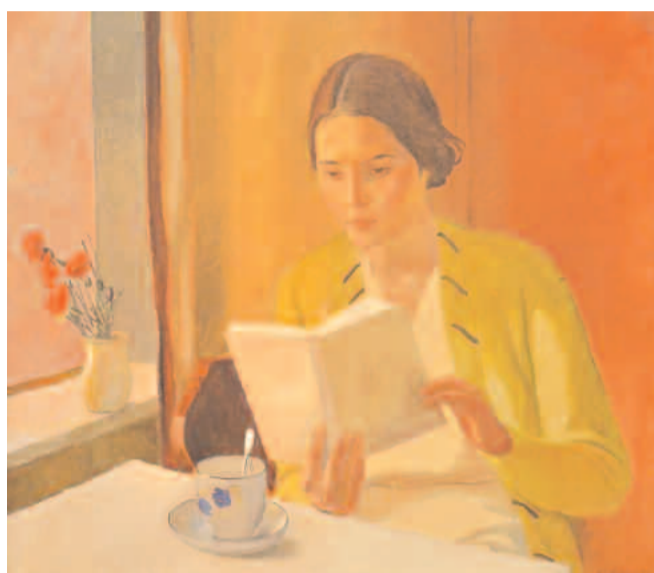
A. A. Deyneka, Giovane donna con libro (1934).

Accanto alle tradizionali sezioni di narrativa e poesia è stata introdotta, limitatamente alla prosa, una nuova sezione riservata ai giovani scrittori di età compresa fra i diciotto e i trent'anni per racconti a tema libero con un'estensione massima di diecimila battute spazi compresi e una quota d'iscrizione di 10 euro. I giovani potranno decidere di partecipare alla sezione, diciamo così, tradizionale di narrativa, nella quale la lunghezza massima delle opere è stata limitata a quindicimila caratteri spazi compresi. Nessuna novità è, invece, prevista per la poesia, con un minimo di tre liriche e un massimo di cinque rispettando il limite