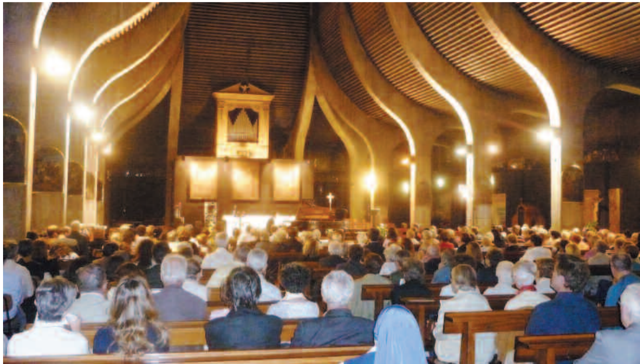
Sopra: la chiesa di san Nicolao della Flue durante Pianoforum e, a destra, don Seno al piano.