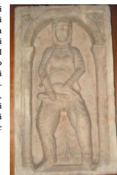
Donna che si tosa il pelo del pube, rilievo del sec. XII. Dalla distrutta Porta Tosa, oggi nel Museo d'arte antica del Castello sforzesco a Milano.

Cinque Giornate, gli ultimi furiosi combattimenti dei Milanesi si tennero proprio a Porta Tosa. Da qui uscirono gli Austriaci per rifugiarsi nel Quadrilatero e qui si proclamò la nostra vittoria. Gli Austriaci tornarono, purtroppo, ma quando si raggiunse l'unità d'Italia, nel 1861, ci si volle ricordare di quel momento di gloria e di esaltazione e Porta Tosa venne chiamata Porta Vittoria.