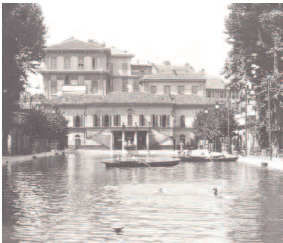
Il complesso dei bagni Diana in una foto d'epoca.

La piscina del Diana diventa subito un luogo di grande attrazione, frequentata da signori che forse vogliono far dimenticare la proverbiale scarsa dimestichezza dei Milanesi con il nuoto.