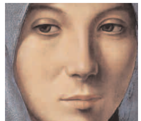
Antonello da Messina, La Vergine dell'Annunciazione, particolare.